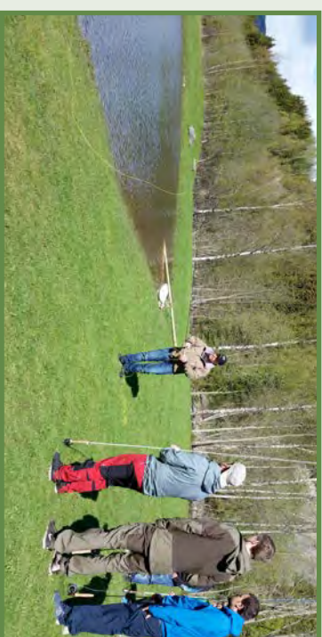
Fra fluefiskekurs i dammen i Follebu